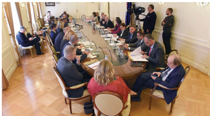
Sjednica Savjeta za nacionalne manjine

Glavnim problemom u implementaciji dijelova UZPNM-a smatram neusklađenost UZPNM-a sa svijetom u kojem živimo te smatram kako bi ga trebalo mijenjati, odnosno uskladiti sa današnjim političkim i životnim okolnostima u Republici Hrvatskoj i svijetu, posebice na način da se normira pojam stečenih prava, ali i da se pravovi postavljeni kao limiti za ostvarivanje nekih manjinskih prava u UZPNM-u usklade kako sa europskim normama, tako i sa potrebama nacionalnih manjina.